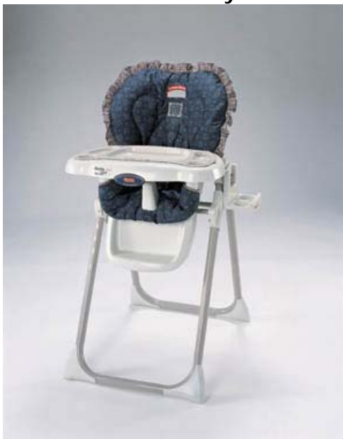
Chaise enfant Healthy Care™