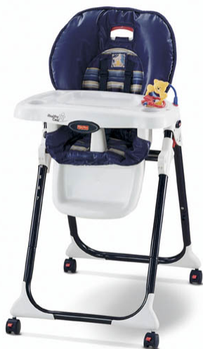
Healthy Care™ Kinderhochstuhl